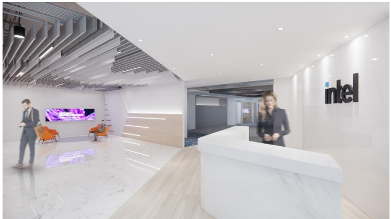
供室內設計、維修及裝潢所需之建材銷售等