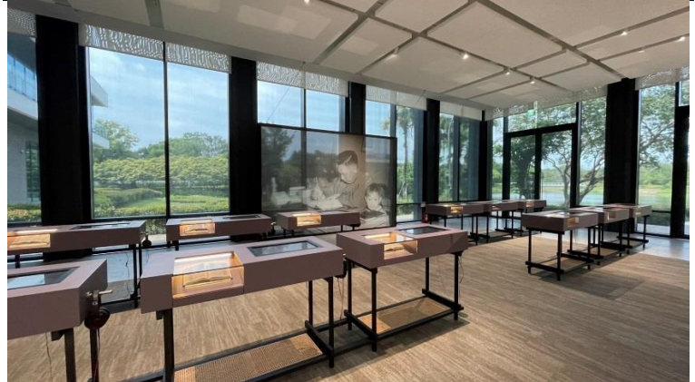
設計、維修、建材銷售