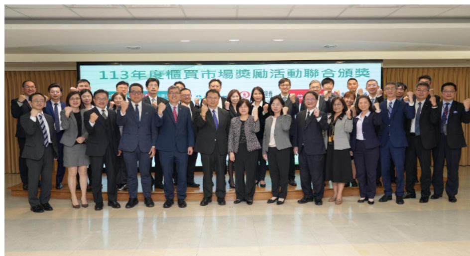
櫃買中心舉辦各類商品發行及交易競賽聯合頒獎典禮

未來，櫃買中心將持續評估市場需求與發展趨勢，滾動式精進各項交易制度，提升交易便利性與市場韌性，強化資本市場永續發展基礎。