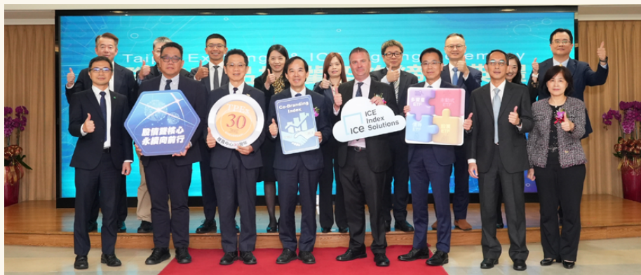
櫃買中心與ICE指數公司締約典禮

櫃買中心已於2024年11月與國際指數公司ICE Data Indices, LLC簽署聯名商品授權契約，未來可編製之指數將涵蓋股票、債券及多資產等類別。櫃買中心未來將持續視市場需求，評估編製包含永續或氣候主題在內的新型指數，俾利提供投資人多元化的投資選擇。