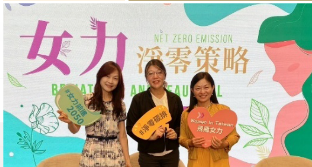
女創沙龍暨趨勢講座活動照片

邀請經濟部淨零辦公室/臺灣綜合研究院研究員進行主題演講，櫃買中心與女創企業營運長等企業代表進行經驗分享。