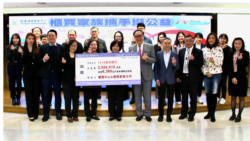
「櫃買家族攜手挺公益 送愛1919食物銀行」捐贈儀式