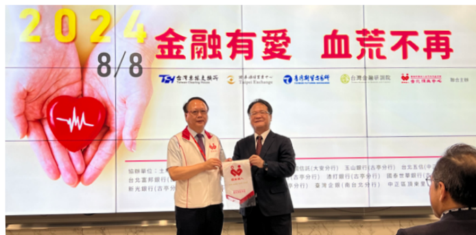
與相關單位聯合主辦捐血活動

為實踐「捐血一袋、救人一命」理念，櫃買中心自2011年起，每年與金融研訓院、期交所及臺北捐血中心聯合主辦「金融有愛·血荒不再」捐血活動，2024年於8月8日舉辦捐血活動，另為鼓勵大眾踴躍捐血，活動當天除定點定時安排車輛自古亭捷運站接駁至金融研訓院捐血，亦提供禮品予捐血民眾。