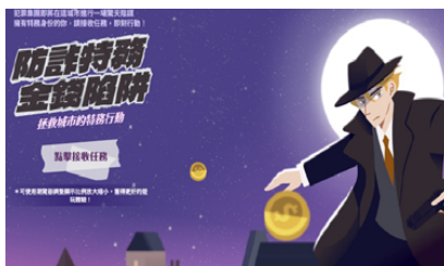
「2024年第二次防制金融投資詐騙 線上互動遊戲」