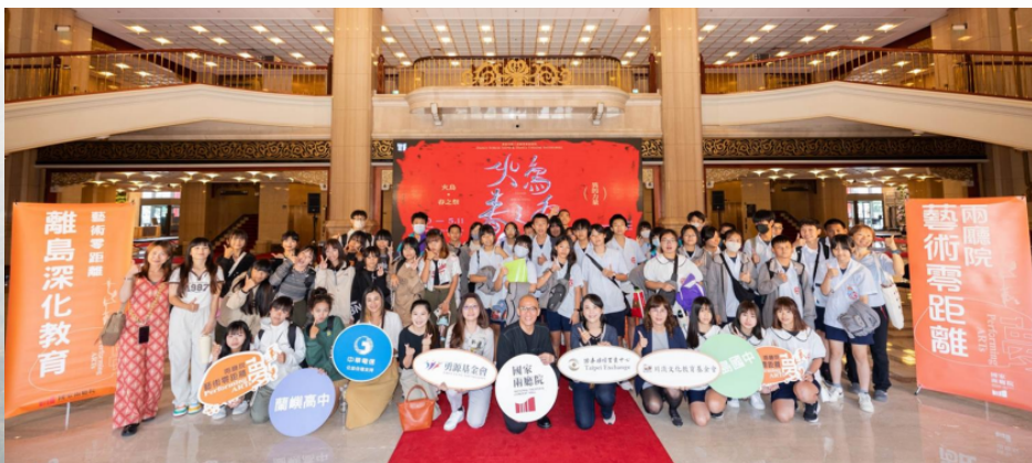
國家兩廳院「藝術零距離：雙離島深化教育專案」

此外，櫃買中心亦透過捐助北中南各地家扶中心助學金，支持弱勢學子安心就學，並長期支持國家表演藝術中心國家兩廳院「藝術零距離：雙離島深化教育專案」、臺灣原聲教育協會原住民教育服務計畫等，提升偏鄉學童接觸藝術、音樂及教育學習等機會。