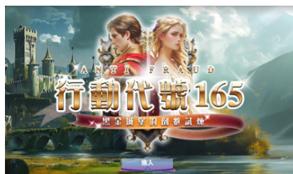
「2024年第一次防制金融投資詐騙 線上互動遊戲」

櫃買中心持續彙整各項金融投資詐騙資訊，並運用多元管道進行防制金融投資詐騙宣導，以提升民眾防詐意識。